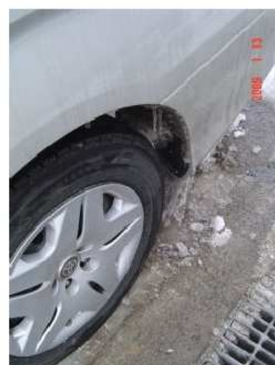
↑フェンダーにつららができてましたオットオ!(´o´)/