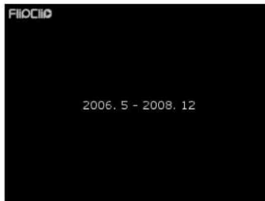
2006年5月から2008年12月までに、お仕事させていただいた物件の中から選んだ写真です。

家族の雰囲気を映しこんだ家づくりを目指しています。 そして、そこに住む家族の雰囲気が感じられるような家づくりを目指しています。