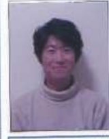
平成 年 月 撮影