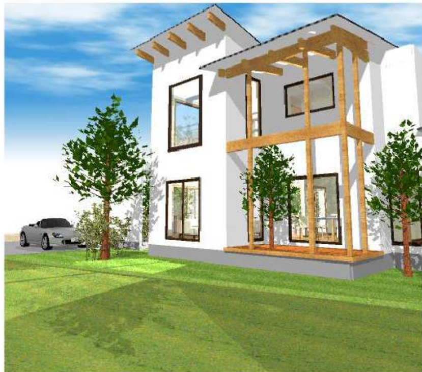
木々の林の中に建っているような家をイメージ